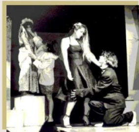
dramske grupe 1983.-1993.