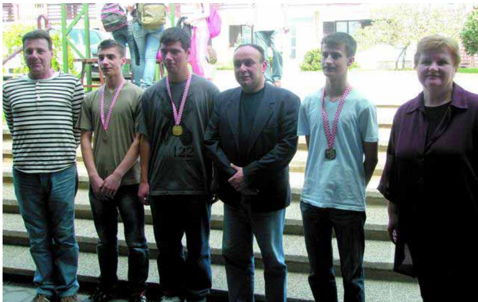
Trojica najuspješnijih učenika i njihovi mentori