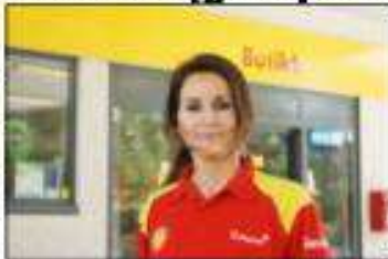
Shellstasjonen på Åsnes er nå gjenåpnet etter å ha vært stengt i fire dager.

Etter å ha blitt stengt i fire dager har Shellstasjonen på Åsnes, rett nord for Aesdalen, på ny åpnet dørene.